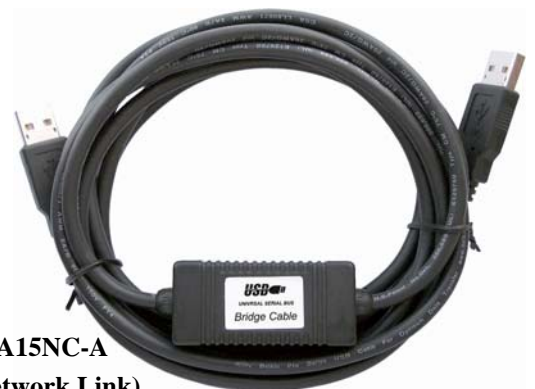
UE-AA15NC-A (USB Network Link)

Compliant with USB specification version 1.1