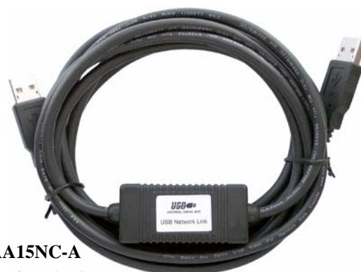
UE-AA15NC-A (USB 双机网络线)