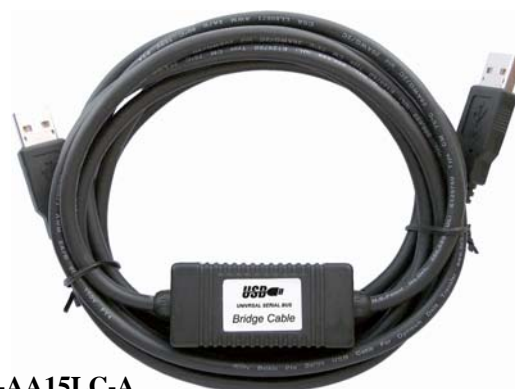
UE-AA15LC-A (USB 双机桥接线)