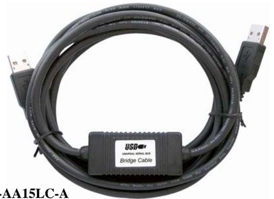
UE-AA15LC-A (USB Bridge Cable)